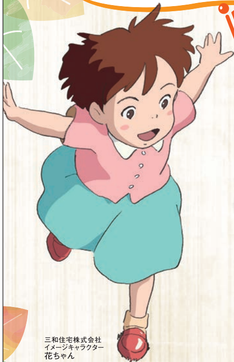
三和住宅株式会社 イメージキャラクター 花ちゃん