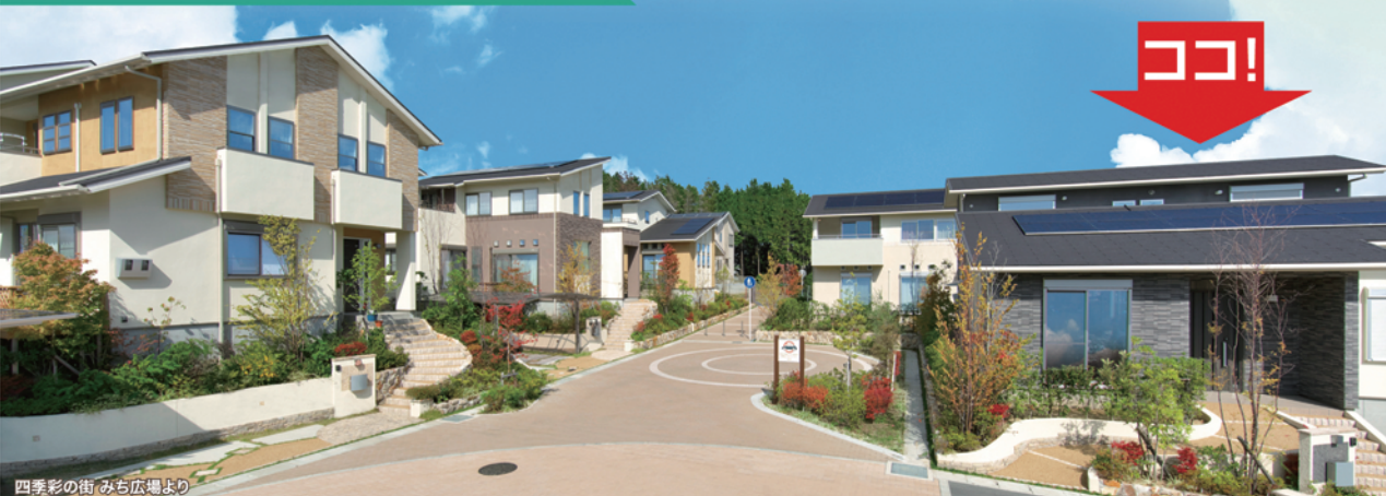
四季彩の街 みち広場より