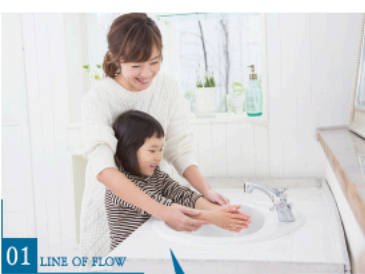
01 LINE OF FLOW