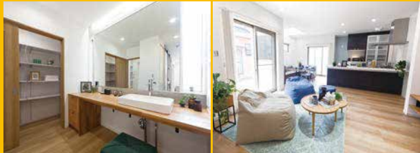
広々と使用できるパウダーサロン 趣味も楽しめるリラックスリビング

+書斎+シューズクローク +ファミリークローゼット +ウォークインクローゼット 敷地面積 / 214.24㎡ (約64.80坪) 1F床面積 / 64.59㎡ 2F床面積 / 45.54㎡ 延床面積 / 110.13㎡ (約33.31坪) 約64.80坪